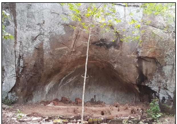
ඡායාරූපය 3. හල්මිල්ලවැටිය ටැම් ලිපිය (ඉහළ) ඡායාරූපය 4. හඳුනා ලත් විහාර සංකීර්ණය (පහළ)

ඒ බව රජකොල් සම්දරුවන්, කැමියන්, වැරියන්, කුඩින් වැනි භාවිතවලින් පෙනේ. විශේෂයෙන්ම ආරාම සතු