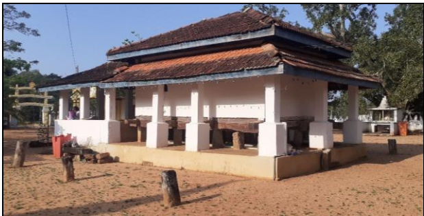
ඡායාරූපය 5. ගෝනමැරියාව වේරගම රජමහා විහාරයේ ටැම්පිට විහාර ගෙය

අය්යනායක දේව වන්දනය බහුලව ඇදහීම් සිදුකරනු ලැබේ (බන්දුපාල 2022). එමෙන්ම මුට්ටි නැමීමේ මංගල්‍යය, කිරි ඉතිරවීම වැනි අභිචාර ක්‍රම ද කුංචුට්ටු කෝරළයේ අතීතයේ සිට පැවත එන සංස්කෘතික අංගයන් යටතට ගැනේ. මේ ආකාරයෙන් වූ ඇදහිලි විශ්වාසයන් බොහෝමයක් මේ ප්‍රදේශයට ආවේණිකව ගොඩනැගුණ ඒවා වන අතර බොහෝමයක් ලක්ෂණ ද්‍රව්‍ය ආභාෂය යටතේ දායාද වූ ඒවා ලෙස සැලකේ (බන්දුපාල 2022). එමෙන්ම විහාර හා දේවාල පදනම් කර ගනිමින් අලුත් සහල් මංගල්‍යය, පරණ මංගල්‍යය, දුරැත්තේ මංගල්‍යය හා පෙරහැර කටයුතු සිදුකරනු ලැබේ. විහාරහල්මිලිලෑව සුලුගල් දඹුලු විහාරයේ හා ගෝනමැරියාව වේරගම රජමහා විහාරයන්හි දේවාල පදනම් කරගෙන එම කටයුතු සිදු කිරීම අතීතයේ සිට පැවත එන සිරිතකි (ධම්මරක්ඛිත හිමි 2022). මේ ආකාරයට මහනුවර රාජධානි සමය තුළ කුංචුට්ටු කෝරළයේ සංස්කෘතික වශයෙන් වැදගත් වෙනස්කම් රාශියක් ඇති වූ බව පෙන්වා දිය හැකිය.